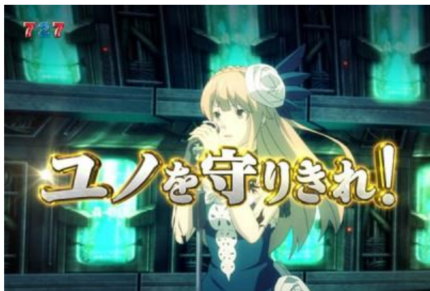
3.7 圖案聽牌時的專用立直，發展就為大好機