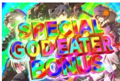
SPECIAL GOD EATER BONUS