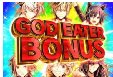
GOD EATER BONUS

神對決 RUSH 中的大當全部有三種，ROUND 數不同但是都會繼續神對決 RUSH SPECIAL 為 10R 確定、EPISODE 為 7R 以上、一般的 BONUS 為 4R 以上 EXTRA BONUS 出現時則延長 3R，勝利出現則次回大當濃厚