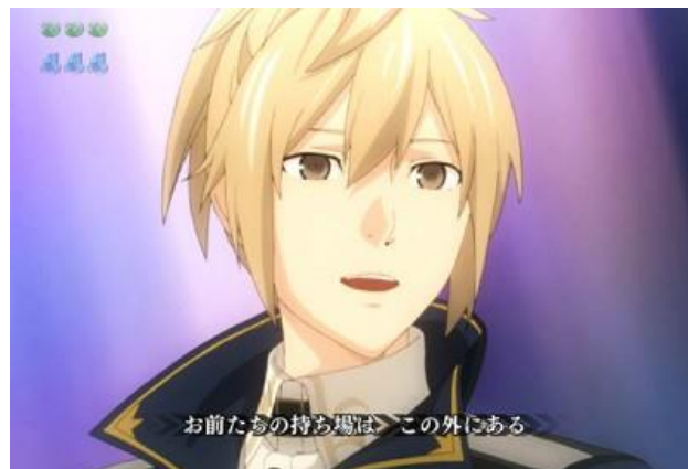
超好機的激熱立直演出，神對決 RUSH 突入濃厚