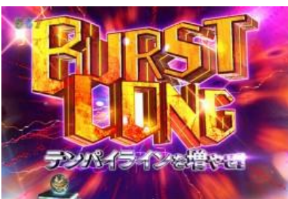
BURST LONG 演出