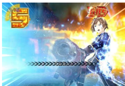
10 COUNT CHARGE