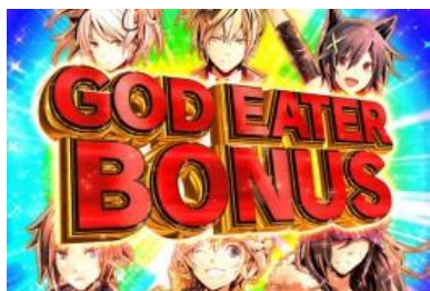
GOD EATER BONUS