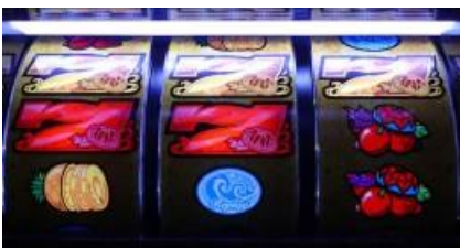
SUPER BIG BONUS