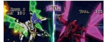
DUAL COMBAT 場景

滯在場景會示唆內部狀態，此狀態會影響 KMB 的上乘抽選，上面越右邊的期待度越高