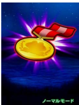
泡泡占卜演出中出現的物品

每消化 128G 發生的演出，觸摸畫面後會出現 物品，會示唆剩餘規定轉數或庫存個數等