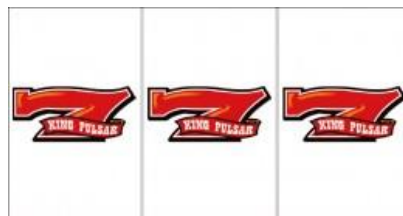
紅 7 BIG