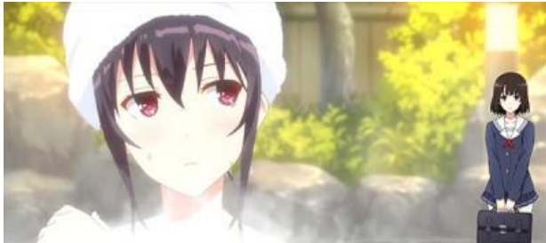
溫泉場景 (前兆濃厚)