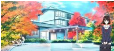
旅館場景 (跳過模式示唆)