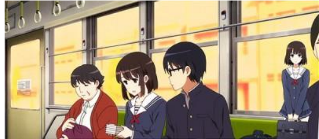
電車場景 (跳過模式+高確濃厚)