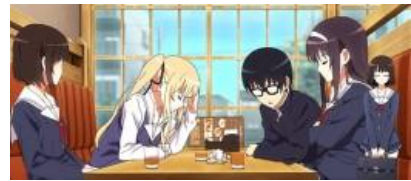
喫茶店場景 (高確濃厚)