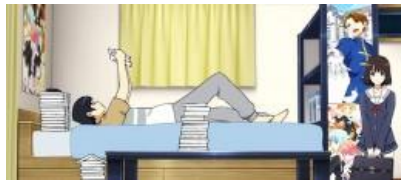
倫也場景 (高確示唆)