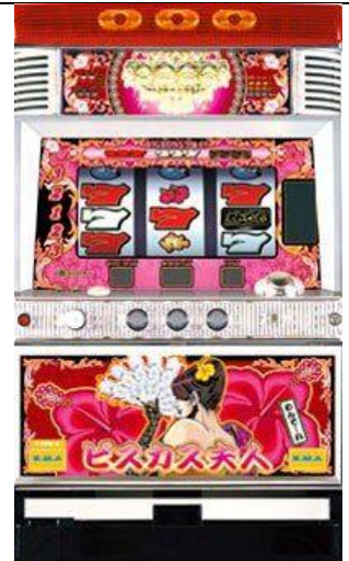
ビスカス夫人(夫人面板)