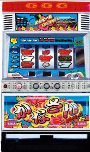
青パネル(藍色面板)