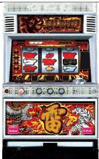
イカヅチパネル(雷鳴面板)