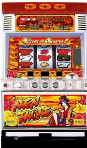
泡盛パネル(沖繩面板)