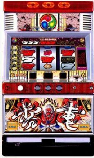
雷電パネル(雷電面板)