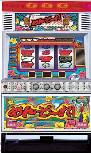
青パネル(藍色面板)