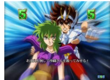
シャイナ VS 海皇