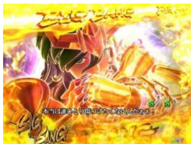
瞬 VS ソレント