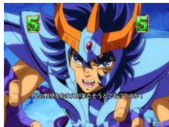
一輝 VS カノン