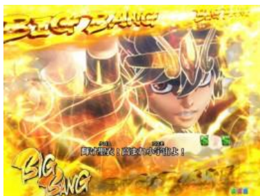
星矢 VS バイアン