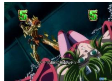
星矢/瞬 VS カーサ