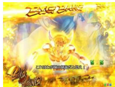
氷河 VS アイザック