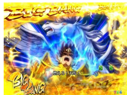
メインブレドウィナ