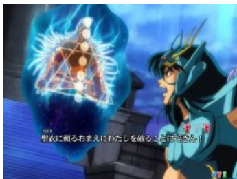
紫龍 VS クリシュナ