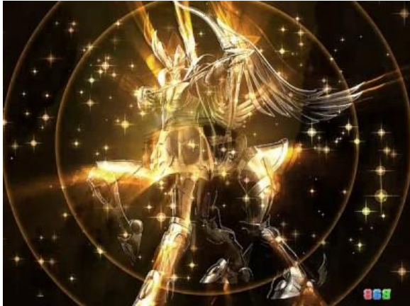
サジタリアス發進預告