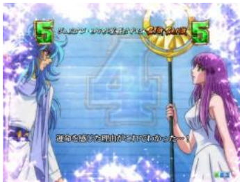
雅典娜與海皇的相見