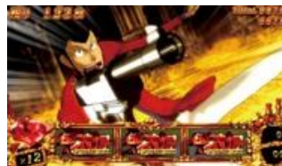
守護連續擊退演出