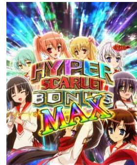
HYPER SCARLET BONUS MAX

SCARLET BONUS 為 3R 大當，通常時大當會突入強襲任務~Reload~，電嘴大當會突入強襲任務