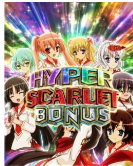
HYPER SCARLET BONUS