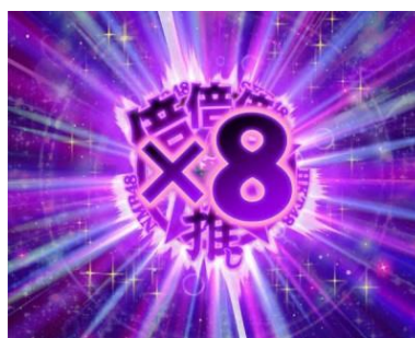
滯在中的推薦點數上乘會變成 2~8 倍