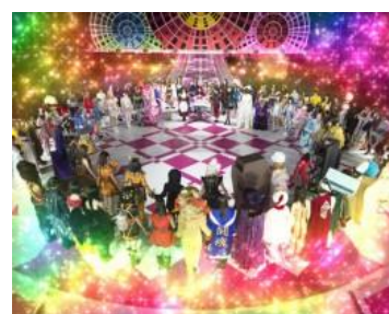
完成 100 人圓陣！

從上面的兩個模式發展，演出除了上面三個還有「喊叫 48!」「完成圓陣！」共五個演出 哪個挑戰成功都是當選 ART 確定。「破壞隕石」為大好機、「完成 100 人圓陣！」為激熱 參戰的隊伍數越多則可以挑戰越多次，所以隊伍數量也很重要