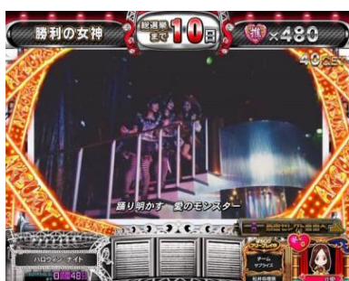
滯在中特殊小役確率上升