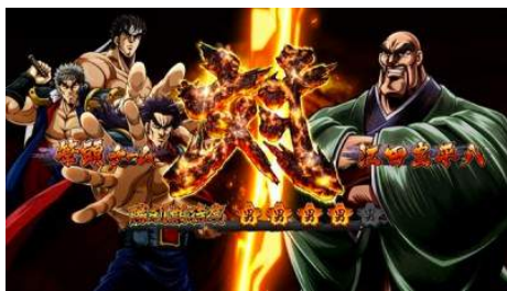
男塾學生 vs 教官