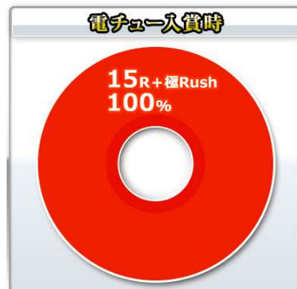
大當 ROUND 數分配比例-電嘴入賞時