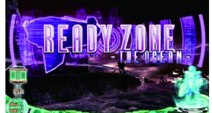
READY ZONE-THE OCEAN-

通常時的場景全部有六種，會示唆自力 CZ 的突入期待度，越下方越右邊的場景期待度越高