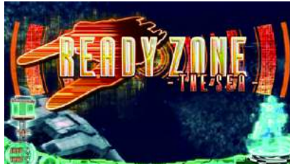
READY ZONE-THE SEA-