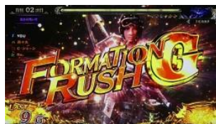
FORMATION RUSH G