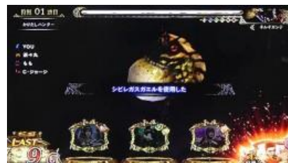
シブレガスガエル

翻倒、麻痺等一部分的狀態異常發動時會封住魔物的行動，此時無論成立小役一定攻擊確定 如果狀態異常持續就能連續攻擊，此時 FR 的轉數也會停止減少。基本上給予傷害時才會累積後發動 只有シブレガスガエル會在 FR 中成立特殊小役或是銅鐘時抽選發動