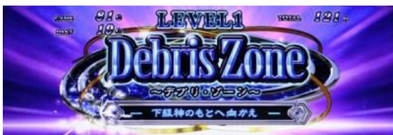
Lv1 「Debris Zone」