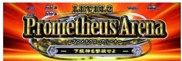
Lv2 「Prometheus Arena」