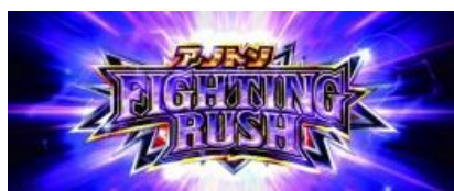
安東 FIGHTING RUSH