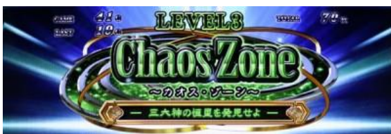
Lv3 「Chaos Zone」