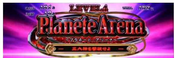
Lv4 「Planete Arena」

Lv1 中發現有下級神在的競技場則等級上升，邊框的顏色期待度依序為藍<綠<紅<彩 Lv2 中贏過下級神則等級上升，對手期待度：アレス<ヘパイストス<アフロディーテ<アポロン Lv3 中發現三大神所在的恆星則等級上升，邊框的顏色期待度依序為藍<綠<紅<彩 Lv4 中打贏三大神則突入皇家鬪神 PREMIUM，對手期待度：ポセイドン<ハデス<ゼウス 各等級中演出失敗則降格一級，只有 Lv2 會有機會滯在原等級