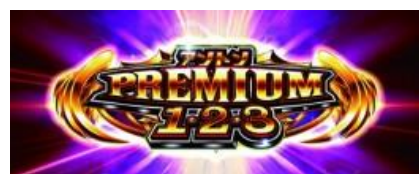
安東 PREMIUM 123

安東 BURNING 平均上乘 80G, 為 5G 繼續的上乘特化, 基本上乘 10G, 特殊小役上乘三位數濃厚 安東 FIGHTING RUSH 平均上乘 140G, RP 成立五次後抽選到銅鐘前會一直繼續 RP 與特殊小役成立時會繼續且上乘, RP 連續則上乘 G 數會上升 安東 PREMIUM 123 平均上乘 210G, 為 15G 繼續的 ST 型, 豬木圖案連線則上乘且回復到 15G 雙線豬木圖案連線則上乘三位數濃厚