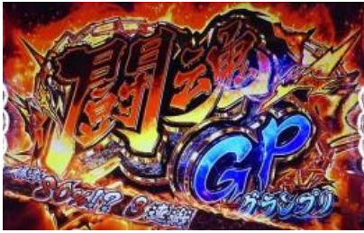
第 1~3 戰