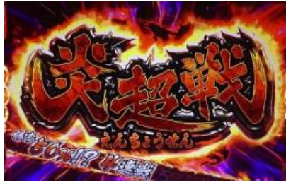
第 4~7 戰