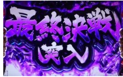
第 8 戰