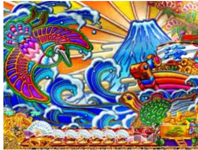
大漁旗的切入演出發生時所發生的大好機立直演出 圖案會乘著櫻吹雪進行演出，目標為獲得大當！