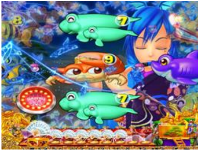
瓦琳演奏橫笛的立直演出 笛子是紅色時則為好機