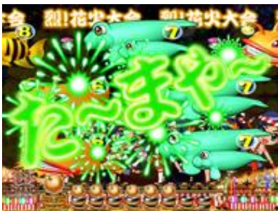
機會目 2 次