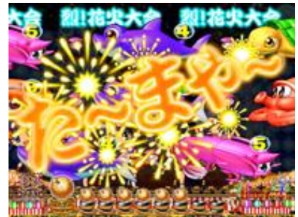
機會目 1 次