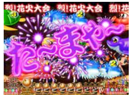
機會目 4 次