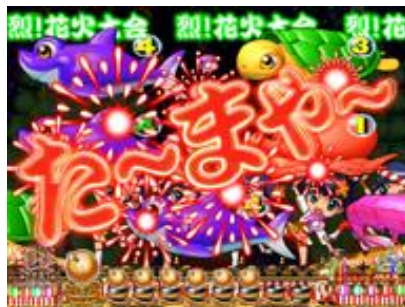
機會目 3 次