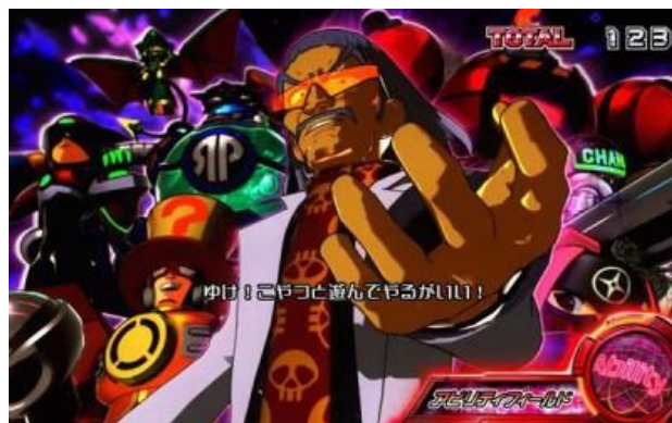
ワイリー與ワイリーナンバーズ登場

ABILITY FIELD 中會發生突入 ABILITY ATTACK 或是轉落通常的演出