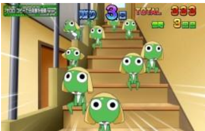
複製 KERORO 侵略作戰