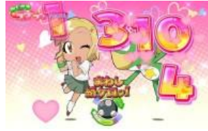
叔叔 LOVELOVE 機會

依照畫面動作 KERON 球役物的演出不同而會有 G 數的期待度變化，依序為：按下！<轉它< 按著按鍵後轉它，上面兩個演出發生時則可期待獲得大量轉數