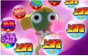
KINKIN KERON 波