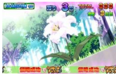
城鎮中開花侵略作戰