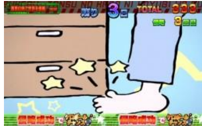
櫃子的角侵略作戰