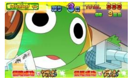
廣播電台侵略作戰