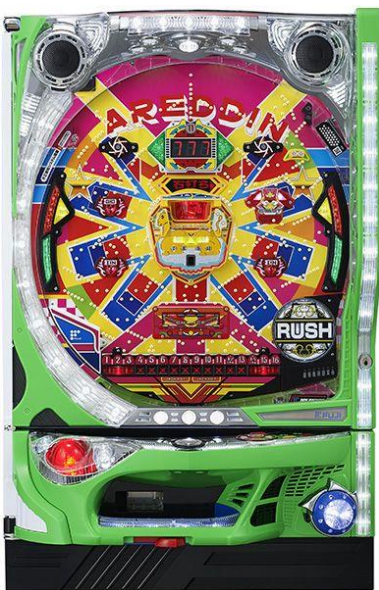
千珠平均該到達回轉數