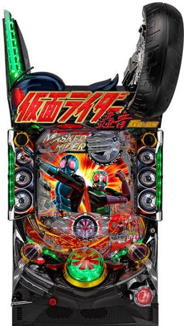
千珠平均該到達回轉數