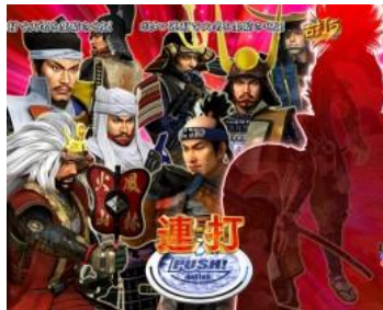
連打按鍵使全大名集結 則獲得確變大當