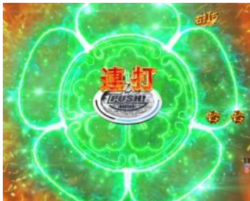
連打按鍵完成極家紋可動體 則獲得確變大當