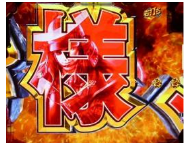
按鍵一擊使極家紋可動體掉落 的話則獲得確變大當