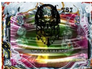
大當圖案增加時則為好機