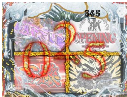
標題暗轉後發生，計時器到 0 時 會發生選擇的面板的演出