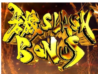
牙狼 SLASH BONUS