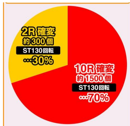
大當 ROUND 數分配比例-電嘴入賞時