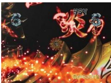
到達我が名は牙狼の話...