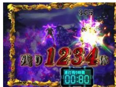
震動停止預告發展的立直