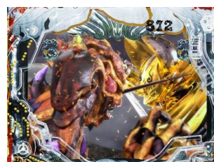
牙狼與ホラー對決，擊破ホラー時為大當濃厚