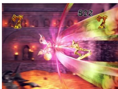
牙狼視點進行演出的新雨宮