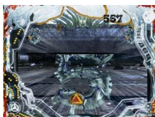
ホラー總共有四種，失敗後牙狼登場時則往 牙狼 SP 立直發展