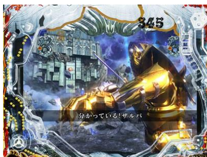
存在最大三次的機會