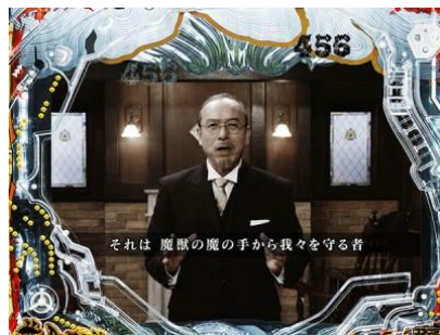
カオル出現時為大好機