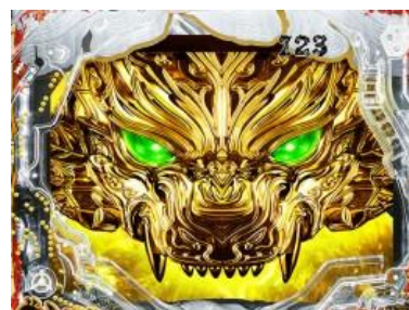
系列作常有的分歧演出。沒有召喚成功則發展ホラーSP 立直 F.O.G.召喚時則發展牙狼 SP 立直，魔天使出現為大好機