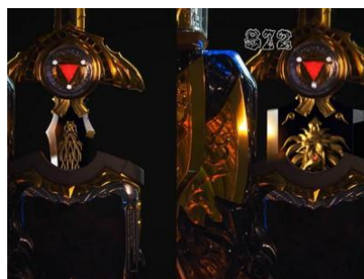
拉出的劍是斬馬劍的話...